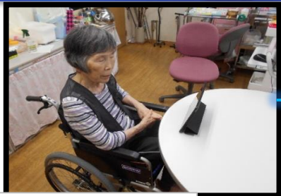
3階サービスステーション

WEB会議ソフトを使用したオンライン面会を始めました。 久々にご家族様と話すことができ、利用者様も喜ばれています。 中には嬉し涙を流されながらお話されていた方もおられました。