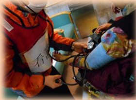
血圧測定しましょうね♪