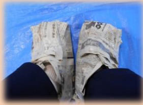
新聞紙で作った靴です!!