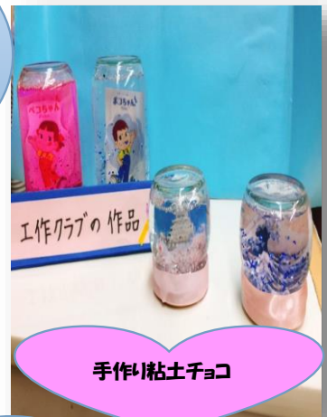
手作り粘土チョコ