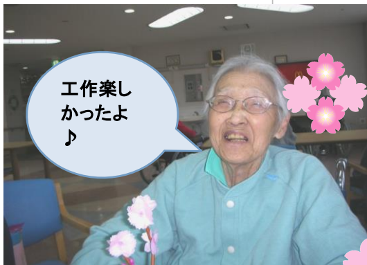
工作楽しかったよ♪