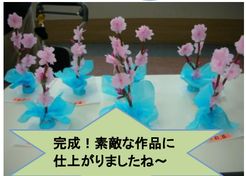
完成！素敵な作品に仕上がりましたね～