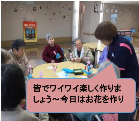
皆でワイワイ楽しく作りましょう～今日はお花を作り

3月24日4階フロアで工作クラブを行いました！！先生はデイのスタッフ（手先がとっても器用なんです）が考えた春らしいお花の作品です☆さくらのCDをかけながら和やかな雰囲気で作っていききました。「どんなのできるんやろう」「楽しみ」と利用者様もワクワク。スタッフと一緒にのりをつけたり、花びらを1枚1枚触って手触りも楽しんでいました。出来上がった作品を見て「うわーお花見や「きれいね」ととても喜ばれていました。完成した作品は詰所前で展示していますので、ぜひ見て下さい！！