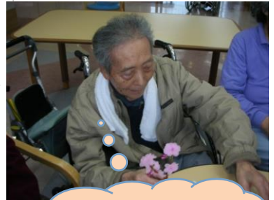
うまくできるかな...楽しみだな

3月24日4階フロアで工作クラブを行いました！！先生はデイのスタッフ（手先がとっても器用なんです）が考えた春らしいお花の作品です☆さくらのCDをかけながら和やかな雰囲気で作っていききました。「どんなのできるんやろう」「楽しみ」と利用者様もワクワク。スタッフと一緒にのりをつけたり、花びらを1枚1枚触って手触りも楽しんでいました。出来上がった作品を見て「うわーお花見や「きれいね」ととても喜ばれていました。完成した作品は詰所前で展示していますので、ぜひ見て下さい！！